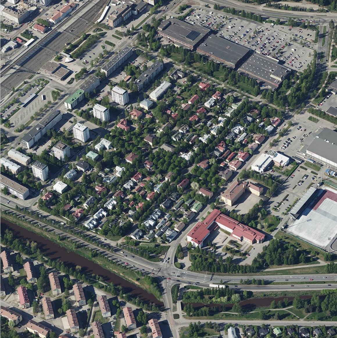
Viistokuva suunnittelualueelta.